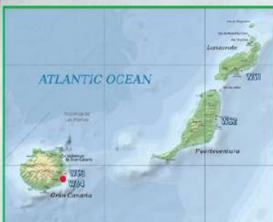
Fig. 1. Ubicación de estaciones de referencia y sitio objetivo