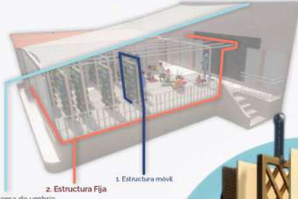
1. Sistema de umbria 2. Estructura Fija